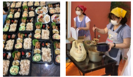
▲指扇子ども食堂のお弁当

子ども食堂の開設を支援しています。さらに子ども食堂の運営施設を増加するように働きかけています。