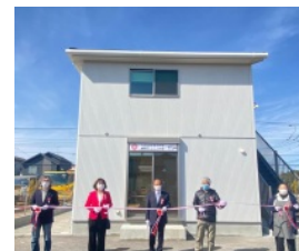
▲指扇北小学校きらきら・にこにこ学童開設